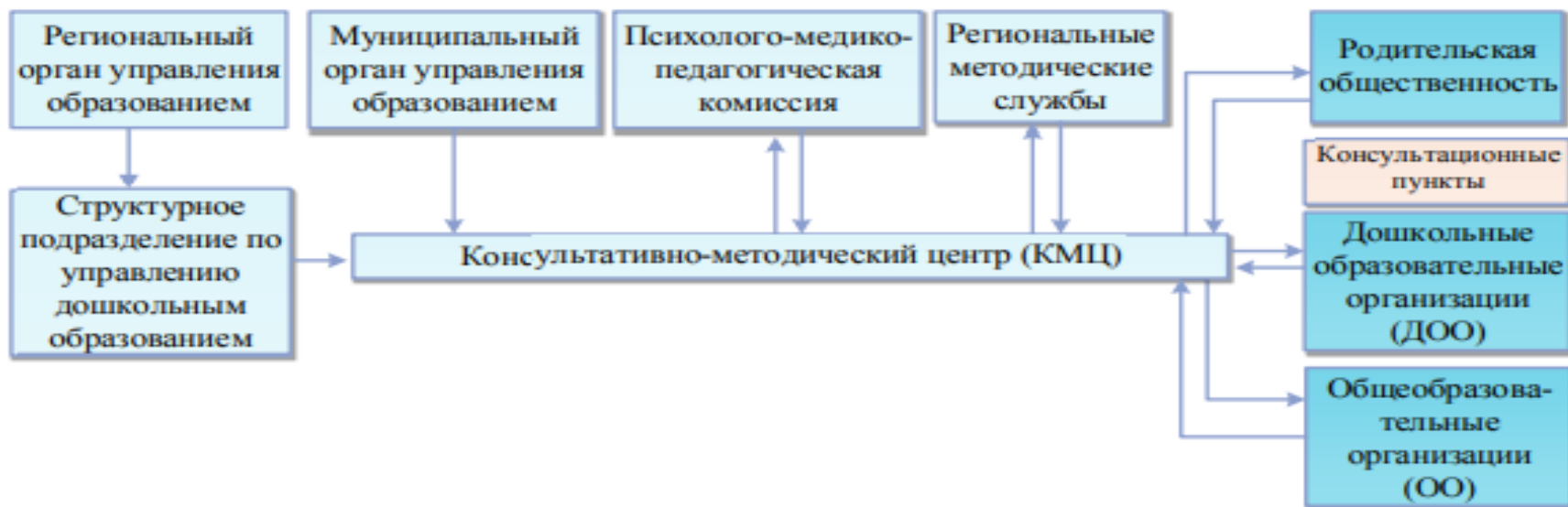
Рисунок 1 – Схема взаимодействия единого КЦ субъекта Российской Федерации с другими участниками образовательных отношений в системе дошкольного образования

Организация предоставления помощи в семейном образовании предполагает наличие как отдельно создающихся органами государственной власти субъектов РФ специализированных консультационных центров, так и функционирующих на базе ДОО и/или общеобразовательных организаций.