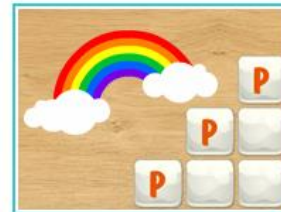
Кроссворд-лесенка "Буква Р"