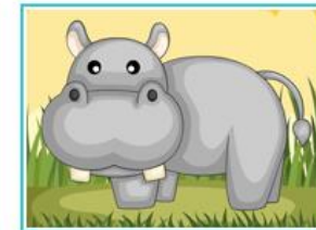
"Собери зверушку" Игра 4