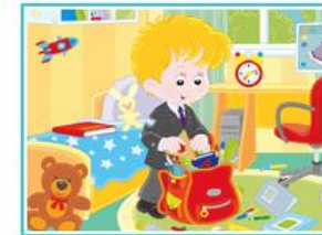
Найди на картинке "Собираясь в школу"