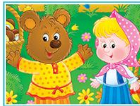
Пазл "Маша и три медведя"