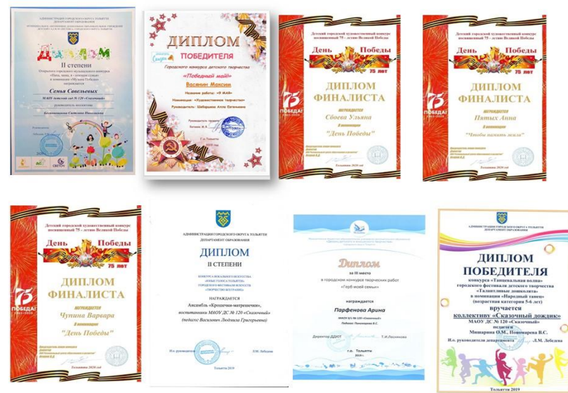
Рис. 4 – достижения воспитанников