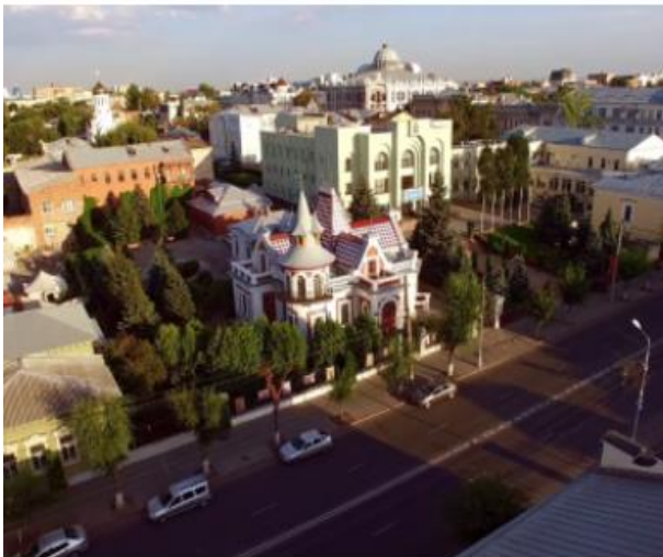
Особняк Клодта | Наследие Самары