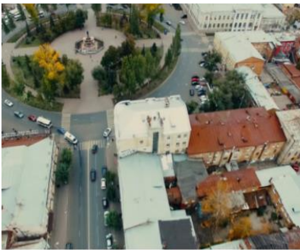
Улица Куйбышева | Наследие Самары