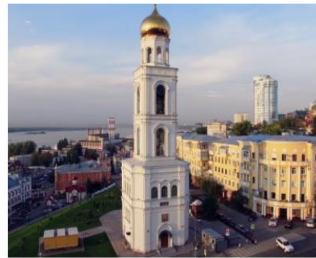
Иверский монастырь | Наследие Самары