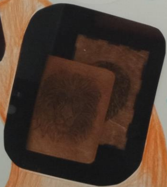
Готовые деревянные и кожаные изделия