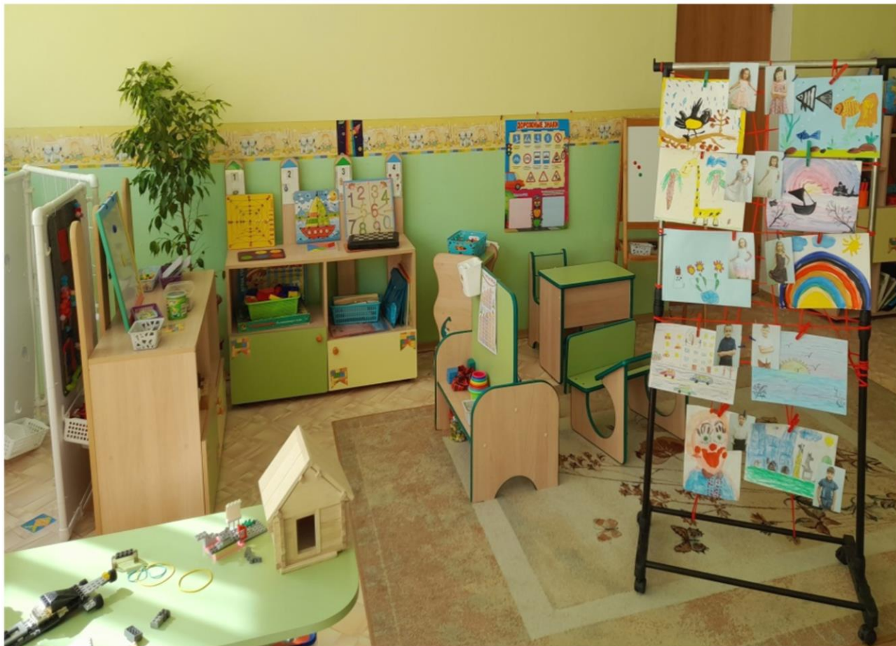
Наличие связанного с детьми оформления пространства группы