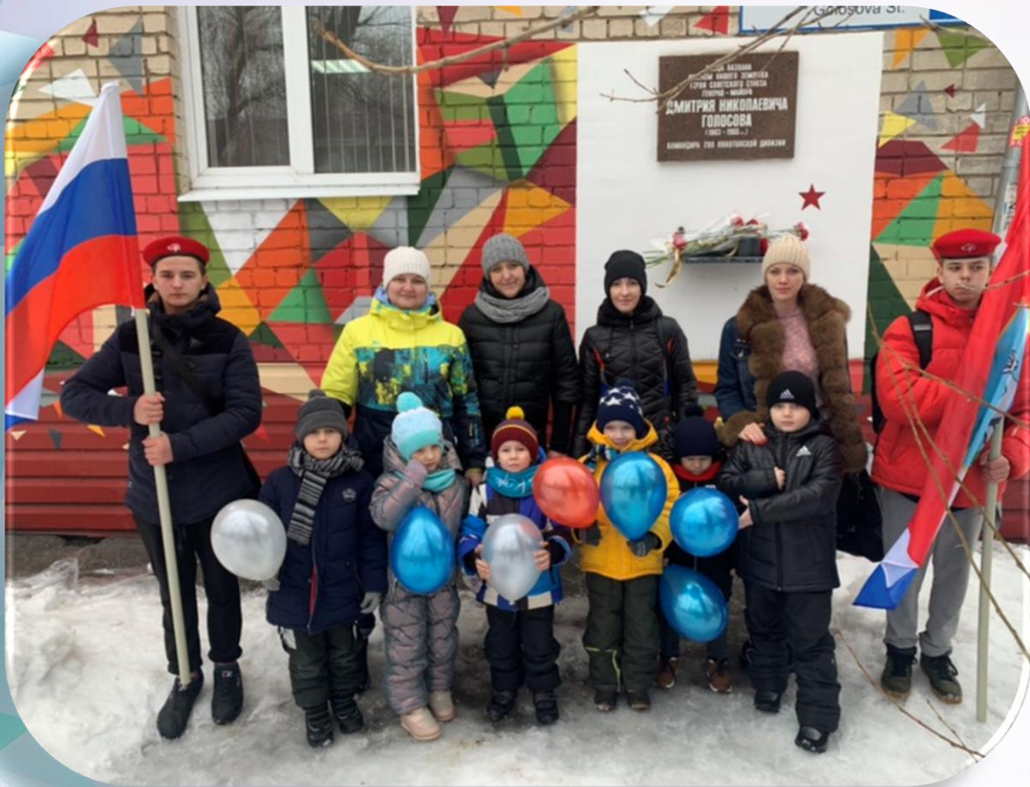
Акция «Живые цветы на снегу»

Участие в мероприятии, посвящённому принятию 7000-го члена в Юнармию