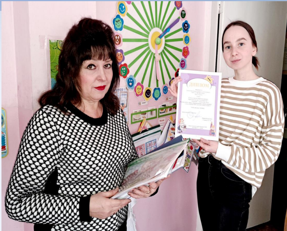
Всероссийский творческий конкурс «Солнечный свет». Проект «Правильно питайся – здоровья набирайся». Победители.

Межрегиональный конкурс методических материалов «Нравственность. Воспитание. Социализация». Дипломанты 2 степени