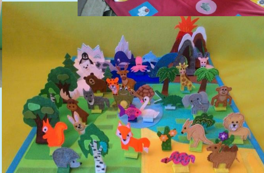
Твистер «Красная книга Самарской Луки»; Животный мир «Самарской Луки»