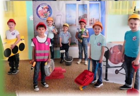
МБУ детский сад № 23 "Волжские капельки" Команда