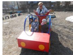
Активная прогулка на свежем воздухе