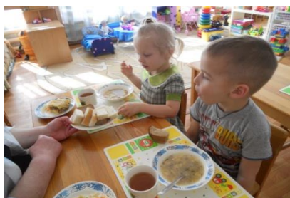
Вызывание речи «Скажи хлеб!»