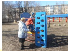
Передвигаемся по лестнице