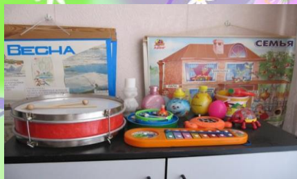
Центр развития слуха