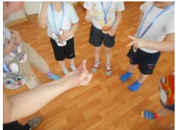
Уточняем правила игры