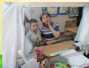
Постановка звука «М» (щека)