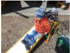
Катаемся с горки