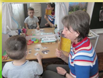
Работа с экраном на слуховое восприятие