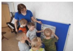
«Прочитай и покажи»