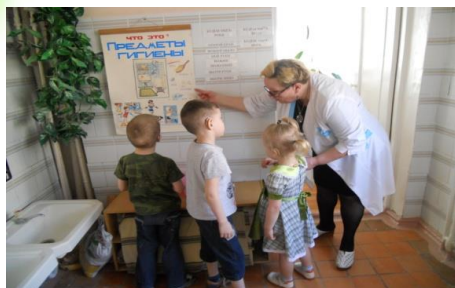
Опорные таблицы в умывальной комнате