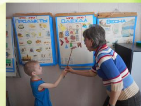
Отработка словаря по лексическим таблицам