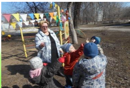
Наблюдение за солнышком на прогулке