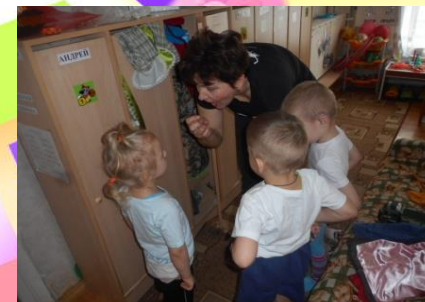
«Считывание с губ»