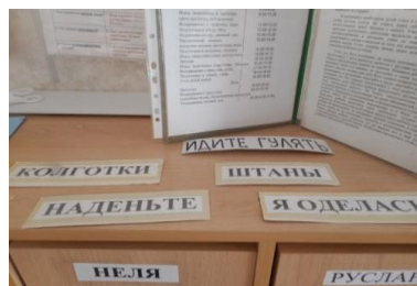
Папки-передвижки для родителей