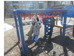
На спортивном тренажёре