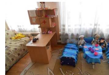
Модуль для с/р игры «Семья»