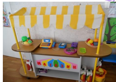
Модуль для с/р игры «Магазин»