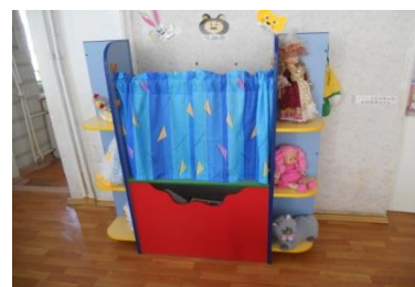
Центр театральной деятельности