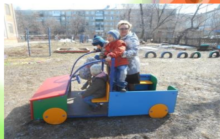
Сюжетно-ролевая игра «Путешествие»