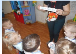
Вызывание интереса к игре