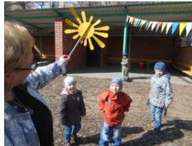
П/и «Солнышко и дождик»