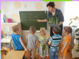
«Знакомство с луком».