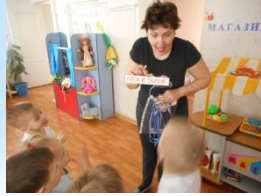
П/и «Лиса и зайцы»