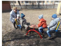
Катаемся на качелях