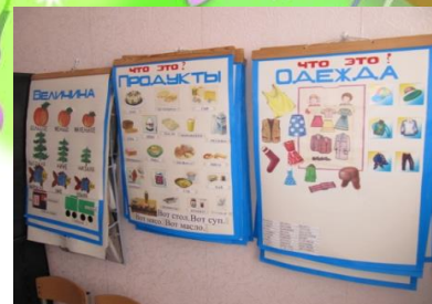
Плакаты по лексике