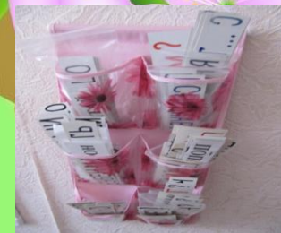
Таблички глобального чтения