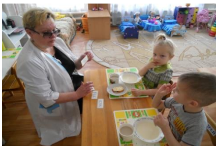
Глобальное чтение «Что это?»