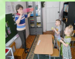
Упражнения с пружинками