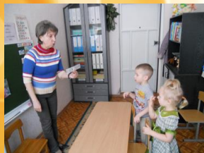
Фонетическая ритмика на развитие дыхания