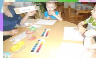
«Будем рисовать сказку»