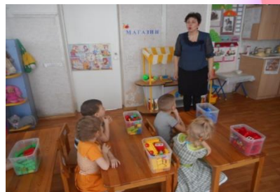
Коллективная работа «Красивая улица»