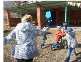
П/и «Кто быстрее?»