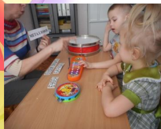
«Будем слушать барабан»