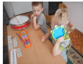
«Будем слушать бубен»