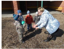
П/и «Поймай мяч»