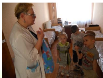
Таблички в спальном комнате