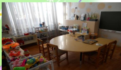
Центр учебной деятельности