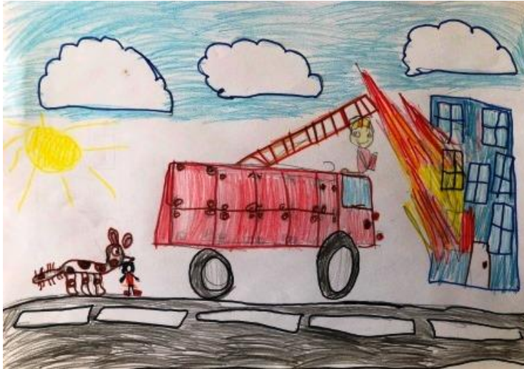
«Собака - спасатель на пожаре»