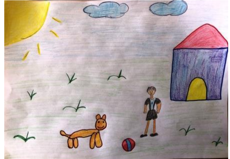
«Друг, давай поиграем!»