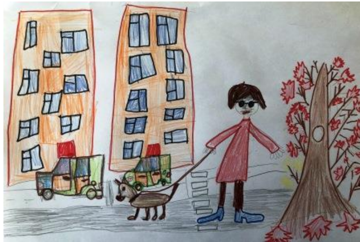
«Собака - поводырь»