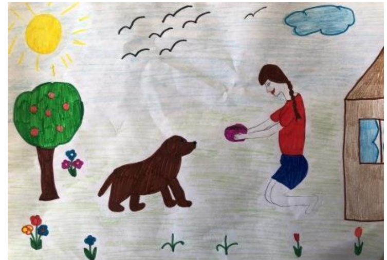
«Вкусный обед для собаки»