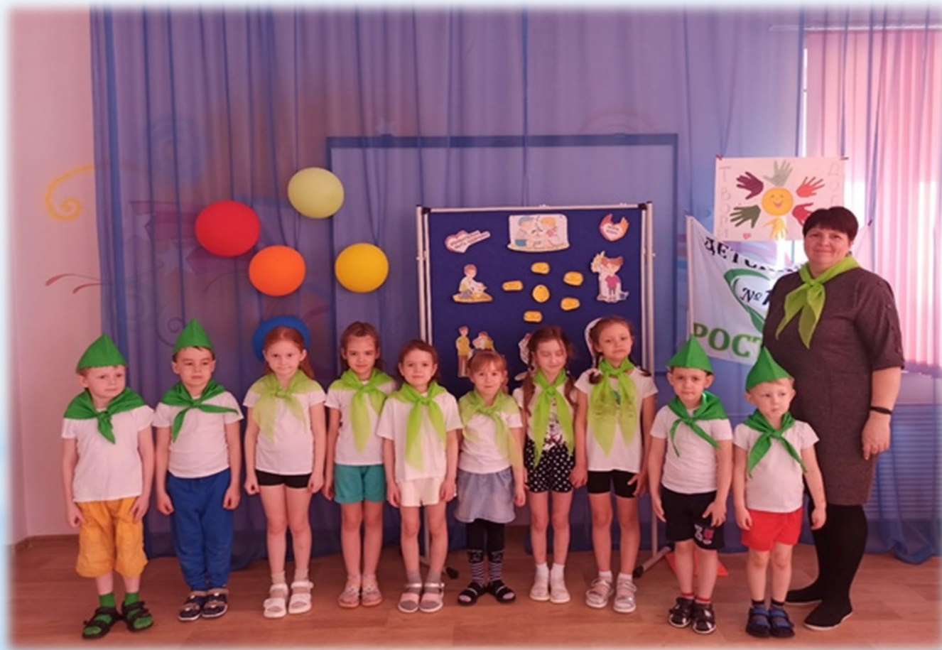
Посвящение в волонтеры