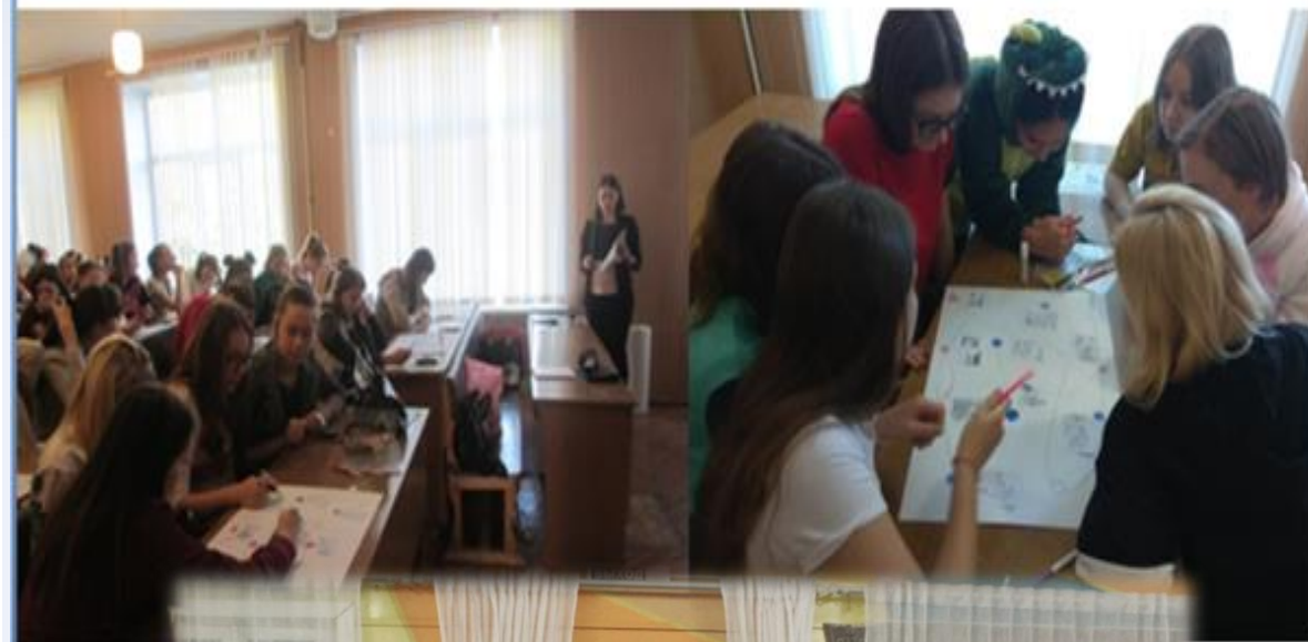
Мастер-класс для студентов социально-педагогического колледжа, будущих воспитателей детских садов.