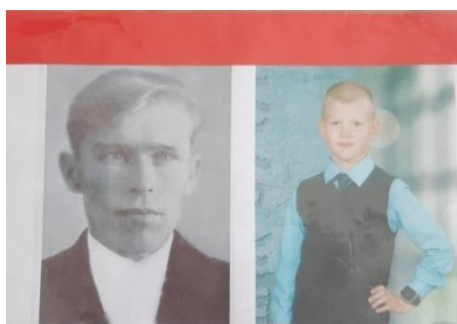
Место для указания Ф.И.О. ветерана и его потомка

15 мая - международный день семьи, я предлагаю посвятить этот классный праздник «Пока мы помним, они живы!» нашим героическим предкам, отстоявшим нашу Великую Родину от фашизма. Сегодня на родительском собрании мы спроектируем внеклассное мероприятие «История страны в историях моей семьи». Давайте вместе подумаем, какие виды взаимодействия можно организовать на этом празднике (работают в группах).