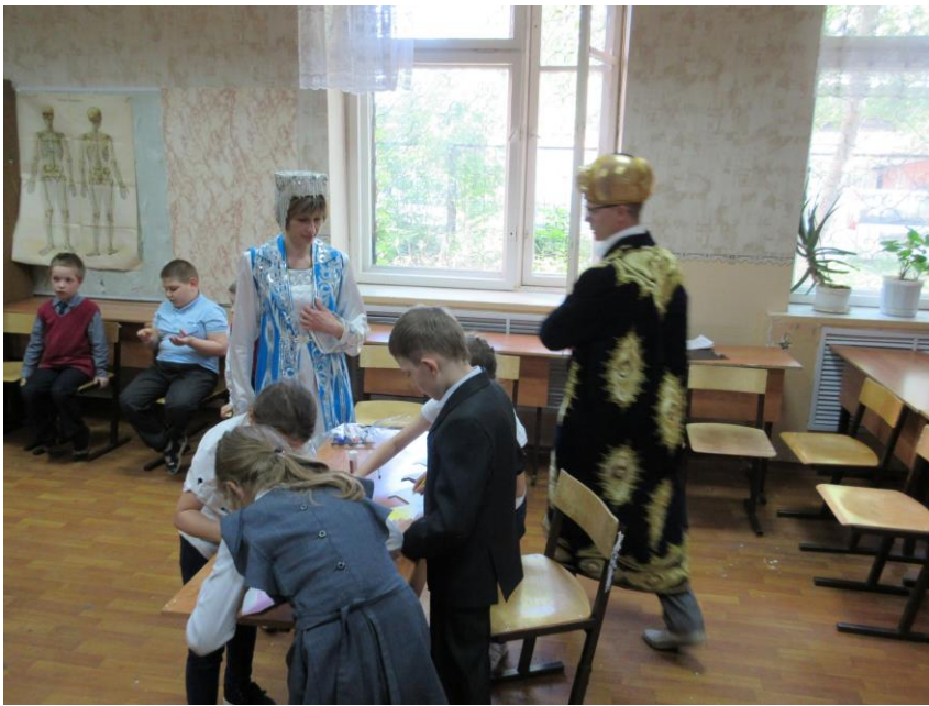
Квест – игра «Калейдоскоп народов мира» школа 39, площадка «Узбекистан»