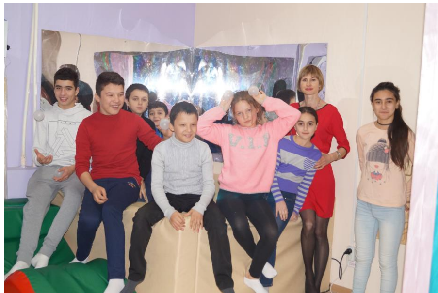
Работа в сенсорной комнате, в спортивном зале центра «Помощь»